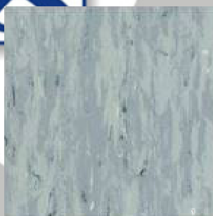
ESTRAD ESD 47002