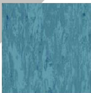
ESTRAD ESD 47055