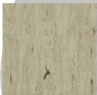
ESTRAD ESD 47007