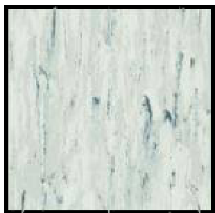
ESTRAD ESD 47001