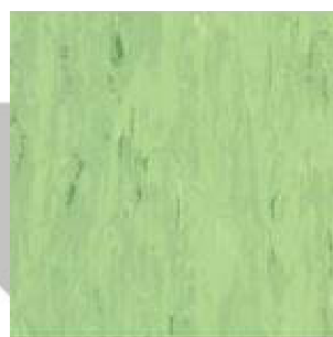
ESTRAD ESD 47064

Kiváló minőségű EU-ban gyártott ESD padlóburkolatok a Lux Kereskedelmi Kft-től.